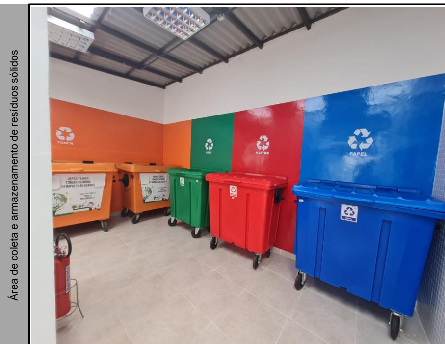
Área de coleta e armazenamento de resíduos sólidos