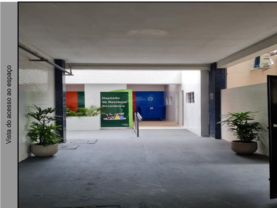
Vista do acesso ao espaço