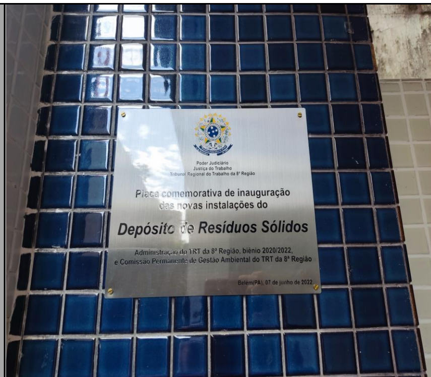
Placa de inauguração do espaço

Poder Judiciário Justiça do Trabalho Tribunal Regional do Trabalho da 8ª Região Piaca comemorativa de inauguração das novas instalações do Depósito de Resíduos Sólidos Administração do TRT da 8ª Região, biênio 2020/2022, e Comissão Permanente de Gestão Ambiental do TRT da 8ª Região Belém(PA), 07 de junho de 2022.