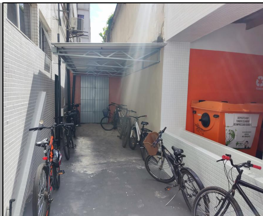
Estacionamento - bicicletário