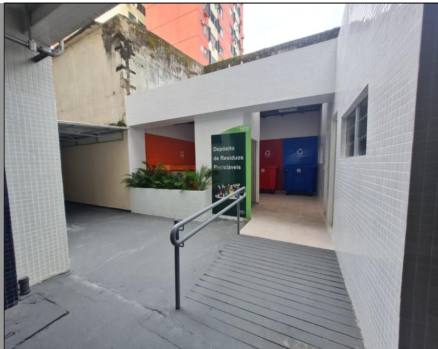
Vista em perspectiva do espaço