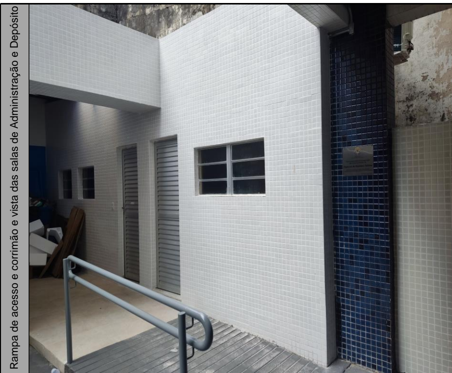
Rampa de acesso e corrimão e vista das salas de Administração e Depósito